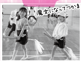
魔女になってつかまえるぞ☆