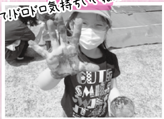
みてみて!ドドド気持ちいいね☆