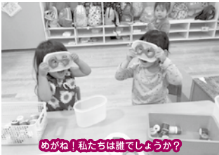
めがね！私たちは誰でしょう？

朝からお帰るまでパワー全開のグリーングループさん！赤ちゃんのお世話が上手なお友達にお料理上手なお友達、お水が大好きなダイナミックなお友達に自転車で颯爽と走り抜けるお友達、ダンスが得意でノリノリなお友達に絵本が好きでじっくり楽しむお友達など個性豊かで賑やかな毎日は発見がいっぱいです。小さな冒険家達は遊びを生み出すのも発見するのも大得意！！一人ひとりの時間を大切に新しい発見の瞬間や出来るようになることの嬉しさを共有している、そんな1年に出来ればと思います☆