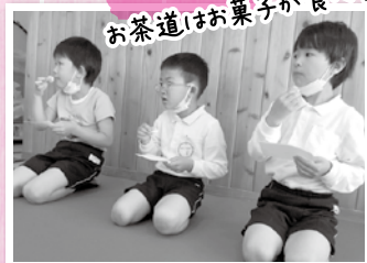
お茶道はお菓子が食べられる♪