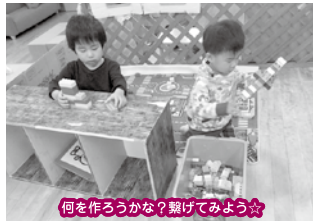
何を作るかな？繋げてみよう☆