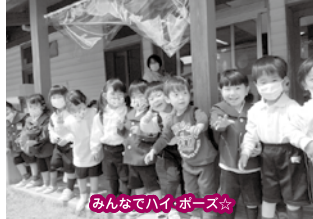
みんなでハイポーズ☆

入園してから涙を流して登園する子が多かったバンビ組さんでしたが、今では園での生活にも慣れ、様々な事に興味を示し、挑戦しながら遊びを楽しんでいます。朝の時間では、みんなノリノリでダンスをする姿を見られ、とても活発で身体を動かすことが好きなバンビ組さんです！また、衣服の着脱など、自分でやりたいという気持ちが高まり、意欲的な姿が見られます。子どもたちの気持ちに寄り添いながら楽しく過ごしていきたいと思っています。