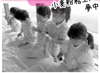
小麦粉粘土に夢中!