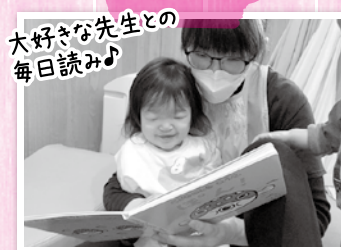
大好きな先生との毎日読み♪