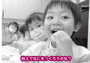
粘土でなをつくらうかな？