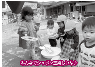
みんなでシャボン玉楽しいな！

4月当初は新しい環境に不安や戸惑いを持ち、涙を見せる子もいたオレンジグループさん。お友だちや保育者との関わりの中で好きな遊びを見つけ、新たな発見や喜びを通して、元気に登園する姿が見られるようになりました。「お外行きたい！」「お水で遊ぶ！」「自転車に乗る」等と、自らの思いを言葉にして伝えたり、朝の身支度や着脱も自分でやろうとしたり、意欲的な姿が見られます。これから子どもたちのやってみたい！挑戦してみよう！とする気持ちが大切に日々の生活の中で新たな発見、楽しい遊びを見つけていきたいです。