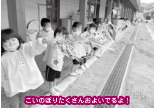
このほりたくさんおよいでるよ！

入園当初は新しい環境に戸惑いや不安の表情もありましたが、少しずつ園生活にも慣れてきました。好奇心旺盛なお友だちが多く、「こんなのがつくりたい！」「こんなことがやりたい！」と、日々様々な遊びを楽しむダンボ組さんのお部屋は可愛らしい笑顔と楽しそうな声で溢れています♪やるときはやる！楽しむときは全力！のメリハリを持ちつつ、子どもたち一人ひとりの思いを受け止めながら成長を見守っていききたいと思います。