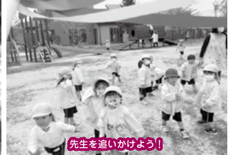
先生を追いかけよう！