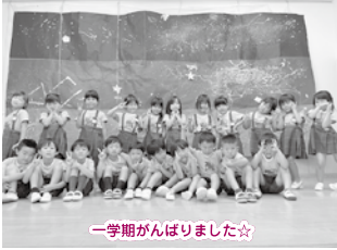
一学期がんばりました☆

進級当初何事にも慎重派が多いように感じられましたが、畑の草むしりゲームとドッチボールに白熱した初夏を過ごし、縄跳びやリリアン・新聞紙棒づくり・浸し染め・砂山作り・積みコップ…等、様々な活動に「競争心」を燃やしてきました☆ぶつかり合いながらも「継続する力」を育てているソウ組さん！9月に1名加わって22名になり、今は「世界」に興味を広げ地球儀を回したりクイズを出し合ったりと刺激し合う毎日です☆メリハリを大切にしながら「仲間がいるって素晴らしい」と繰り返し共感し合うことで、「友だち」を大切にできる力をパワーアップしていきましょう♡