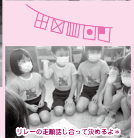
リレーの走順話し合って決めるよ！