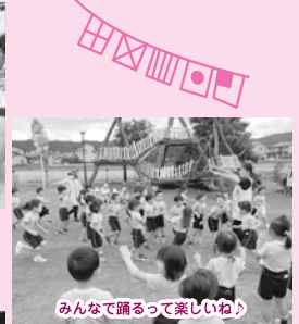
みんなで踊って楽しいね！