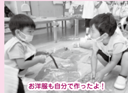
お洋服も自分で作ったよ！

子ども達がとても楽しみにしていた運動会！保育の中で行ってきたことを競技に取り入れてきました。無理なくみんなが楽しんでできる競技を先生方が考え、時には子ども達と話し合いをしながら進めてきましたよ。みんなで踊る【オズの魔法使い】では、他の役も完璧に踊れる子もいるほど、みんなで踊りお話を作り上げることを楽しんでいました。また身体の動きだけでなく、勝ったり負けたり、悔しがったり喜んだり様々な心の動きも経験しました。そんな運動会までの姿をご紹介します！運動会当日は、たくさんの拍手や応援ありがとうございました。