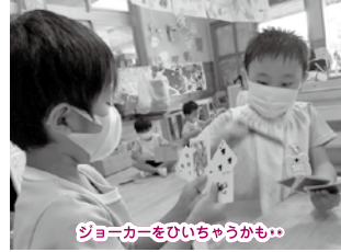
ジョーカーをひいちゃうかも..

いつも元気で笑い声に溢れているキリン組！！森の広場では鉄棒や跳箱に力が入り、毎日練習をする姿が見られ、クラスではオセロやトランプ、コマなどの友達とのやり取りを楽しみながら進める遊びが盛り上がりを見えています！誰にでもある「苦手な事」にはクラスみんなで向き合い「諦めないで挑戦しよう」と気持ちを1つにし、取り組んでいます！時には友達と思いがぶつかり涙を流す時もあるけれど、相手の気持ちを知るために話し合いを何度も行っていきながら、1人1人が優しい気持ちを持てますように！これからも笑顔や元気が絶えないキリン組でいきますよー★