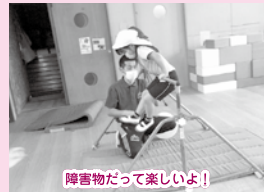
障害物だって楽しいよ！