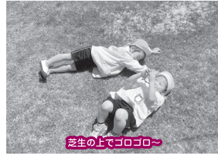
芝生の上でコロコロ～

入園当初は新しい環境に戸惑いや不安を抱く姿も見られましたが、少しずつ慣れてきたことで、やりたいことをどんどんみつけていけるようになってきました。そんなパンピ組のお部屋は、いつも笑顔と笑い声で溢れ、元気いっぱいです！活動をしなごう「なぜ？」「どうして？」と不思議に心動かされる場面も見られるようになってきました。子ども達と様々な経験を通して、「楽しい」「悔しい」「悲しい」などの思いと一緒に感じ、共有をしていきたいと思っております♡