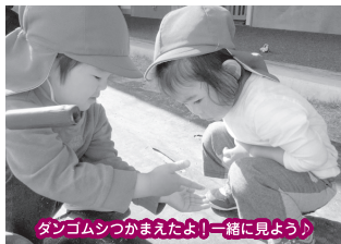
ダンゴムシつかまえたよ！一箱に見よう！

お友だちが大好きで、楽しいおしゃべりに花が咲いているグリーングループさん！「バスに乗ってお出かけしよう！」「お弁当持って学校に行こう！」「プリキュアに変身しよう！」など、身の回りから得た着想や好きな物をお友だちにも伝え、誘い合って遊びの世界を自分たちで作り出す姿があります。まだ少しくはくはな会話やいたずら心も可愛いみんな。どんなお兄さんお姉さんになっていくのか楽しみです。一人ひとりの豊かな個性と育ちを受け止め、新しい発見や楽しみを共有していける、心温かなクラスになっていけたらいいなと思っております♡