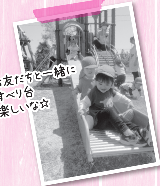
お友だちと一緒に すべり台 楽しいな☆