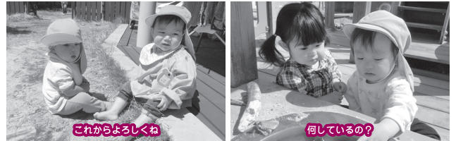
これからよろしくね

満1歳さんは現在5名のお友達が入園しています。1歳のお誕生日を迎えたお友達が随時入園し、3月には全員で15名になる予定です。入園当初は初めての園生活で泣いてしまう姿もありますが、保育者やお友達と一緒に様々な経験を通し成長した姿をこの園だよりなどを通し保護者の皆様にお伝え出来ればと思っています。保育者との愛着関係を築き安心して生活する中で、お友達と関わる楽しさを体験できればと思います。同学年のお友達だけでなく、異年齢さんとの関わりからの成長も大きいので、自らの関りを大切に、成長に結びつく事が出来るようにしていきたいです。