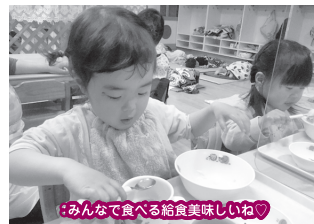
みんなで食べる給食美味しいね♡

4月当初は新しい環境に不安や戸惑いを持ち、涙を見せる子もいたオレンジグループさん。お友だちや保育者との関わりの中で好きな遊びを見つけ、新たな発見や喜びを通して、元気よく登園する姿が増えてきました。「お外行きたい！」や「虫探す」、「自転車に乗る」等、自らの思いを言葉にして伝えたり、身支度や着脱も自分でやろうとしたりと意欲的な姿が見られます。これからも子どもたちのやってみたい！挑戦してみよう！とする気持ちを大切に日々の生活の中で新たな発見、気付きを見つけていきたいです。