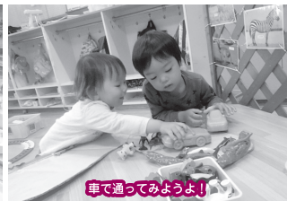
車で通ってみようよ！