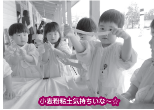
小麦粉粘土土持ちいな～☆