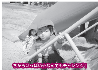
ちからいっぱい☆なんでもチャレンジ！