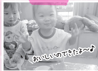
おいしいのできたよ〜!