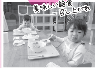
美味しい給食 召し上がれ