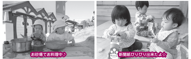
お砂場でお料理中♪

今年度の満2歳児さんは、新入園児3名、進級児16名のお友だちでスタートしました。りんごグループ、すいかグループの2グループに分かれて過ごしています。4月当初は慣れない環境に不安から涙するお友だちもいましたが、抱っこなどのスキンシップや担当保育者との1対1での関わりを通して少しずつ安心して過ごせるようになりました。お部屋や園庭で自分の好きな遊びを見つけられるようになり、笑顔やお話も増えてきました。子どもたちの興味関心・気付きなど、様々な思いを共感しながら一緒に1年間楽しく過ごしていきたいと思っています。