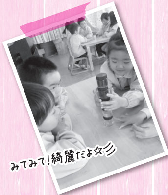
みてみて!綺麗だよ☆