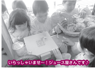
いらっしゃいませ～！ジュース屋さんです♡

4月当初は新しい環境にドキドキ、ワクワク・様々な表情が見られたダンボ組さん。 自分で出来る事が増えていく中で、様々な事に興味を持ち、やってみたいこと・知りたいことがたくさん増えてきました。新しい事に会うたびにまがしいくらい笑顔で駆け出していき☆そんな気持ちに寄り添い、受け止め、一緒に考えたり体験していきながら、楽しい園生活を過ごしていきたいと思っております♡