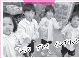
レック プレイ イングリッシュ!