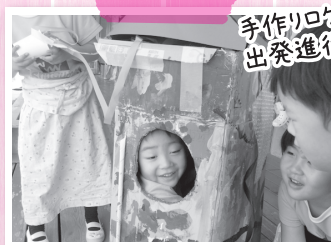
手作りロケットに乗って 出発進行!!