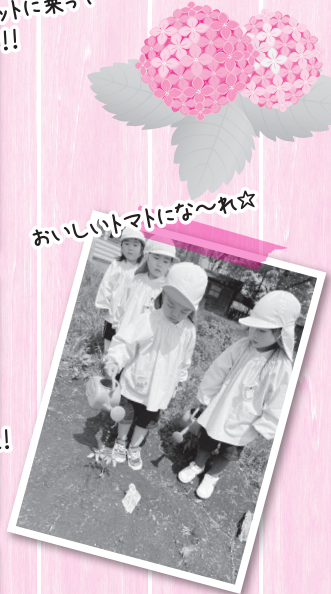
おいしいトマトにな〜れ☆