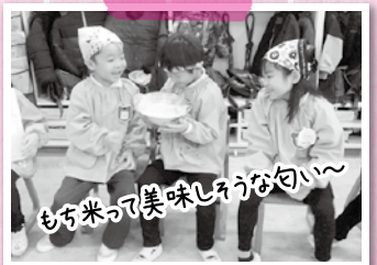
もち米って美味しうな匂い〜