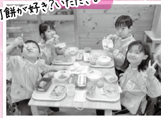
何餅が好き?いただきます!