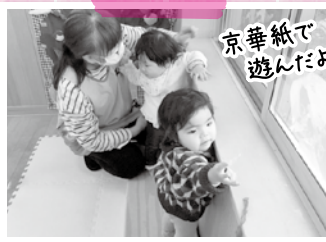
京華紙で遊んだよ