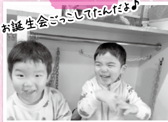
お誕生会ごっこしてたんぽよ♪