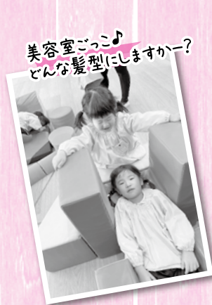
美容室ごっこ♪ どんな髪型にしますかー?