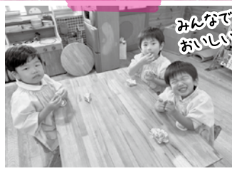
みんなでスイートポテト作り おいしいね