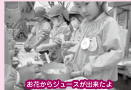
お花からジュースが出来たよ