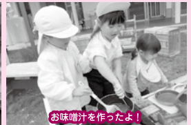
お味噌汁を作ったよ！

今月はお天気の良い日もたくさんありました。「お外でもおまごどしたいな」の子ども達の声から園庭にもおまごどコーナーを設置してみました。年長さんを中心に草花や砂を使ってのいろいろなお料理が出来上がります。それを見て真似して小さいお友達がスプーンで混ぜ混ぜしてみたりと…子ども達の真似をする上手さに驚かされます。年長さんも「お家でお母さんがこうしてたんだ」と真似っこしています。お味噌汁には砂に見立てた味噌を溶かしていました。大人のしていること、ちゃんと見ているんですね。これからも、沢山の発見をお伝えしていきます。