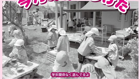
学年関係なく遊んでるよ