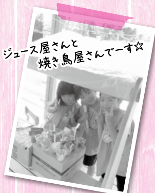
ジュース屋さん 焼き鳥屋さんでーす☆