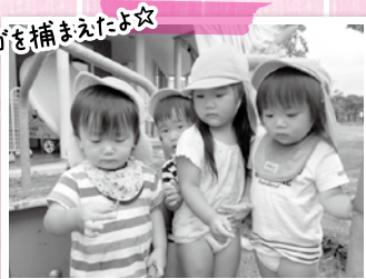
イナゴを捕まえたよ☆