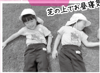
芝の上でお昼寝気持ちいい