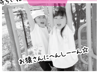
お猿さんにへんしーん☆