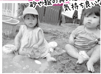
砂や絵の具の感触! 気持ち良いな