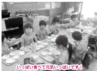
いっぱい食べて元気いっぱいです！

いつも笑顔が絶えない元気いっぱいのキリン組！友達のために行動したり、周りが助けてくれたりとお互いのことを思いながら活動に取り組む仲間思いの気持ちがとても素敵です！！先生の小ボケにすぐ反応してツッコミをいれてくれたり、友達を笑顔にしてくれる声掛けをしてくれたりする楽しい一面もあります！とても頑張り屋さんで、声を掛け合い、練習をしたり作戦を立てたりしながら勝ちを意識してドッジボールやリレーにも取り組んでいます！最後まで諦めない気持ちを持ってお互いに応援し合える仲間思いの楽しいクラスです♡