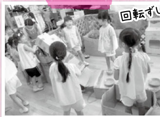
回転ずしの準備中!