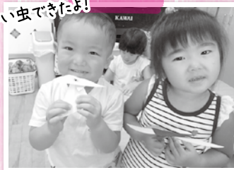
かっこいい虫できたよ!