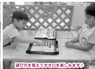
遊び方を覚えてオセロを楽しみます♡