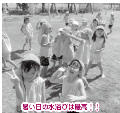
暑い日の水遊びは最高！！