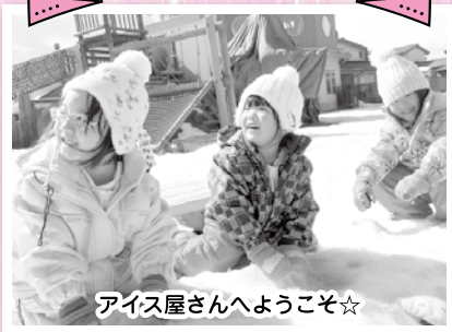
アイス屋さんへようこそ☆