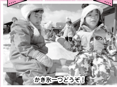
かき氷一つどうぞ!