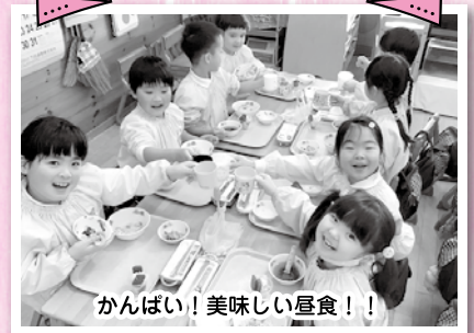
かんぱい!美味しい昼食!!