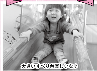
大きいすべり台楽しいな!