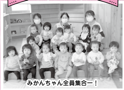
みかんちゃん全員集合ー!