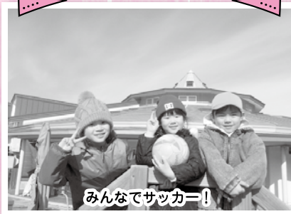
みんなでサッカー!